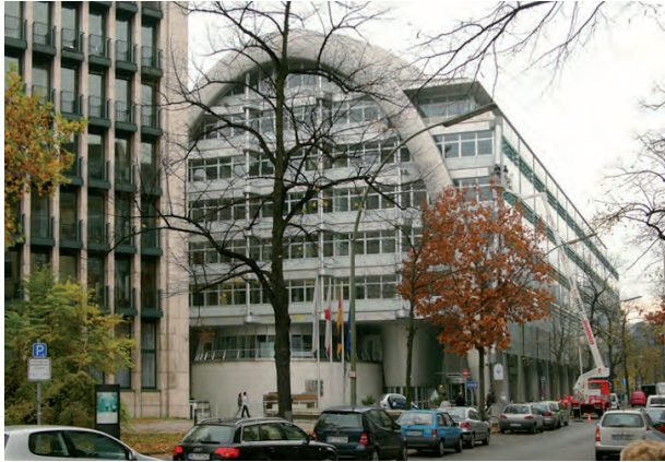
Nicholas Grimshaw & Partner Ludwig Erhard Haus Berlin

Ein Geschäftshaus aus der Spätphase des High-Tech. Die parabelförmige Bogenkonstruktion aus Stahl macht das Erdgeschoss stützenfrei.