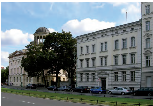
Kuehn Malvezzi Architekten Museum Berggruen Berlin

Implementierung einer komplexen Museumsnutzung in einen denkmalgeschützten Altbau sowie einen Verbindungsgang zum Haupthaus für die Erweiterung der Sammlung.