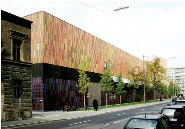
Sauerbruch Hutton Architekten Museum Brandhorst München

Das dreigeschossige Museum mit zentraler Erschließung ergänzt das Museumsareal. Der Zugang über den Kopfbau erweist seine Referenz an Sep Ruf.