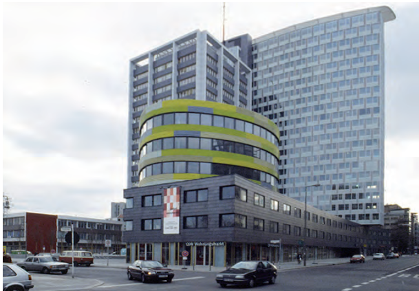
Sauerbruch Hutton Architekten GSW Hauptverwaltung Berlin

Freie städtebauliche Komposition eigenständiger Gebäudeteile in Verbindung mit einem engagierten Energiekonzept und charakteristischer Farbgebung.